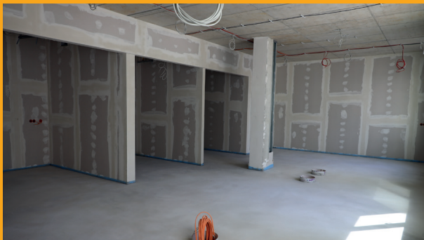
Mitarbeiteräume zum Austausch